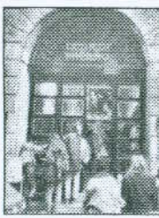
Il Teatro Grassi di via Rovello